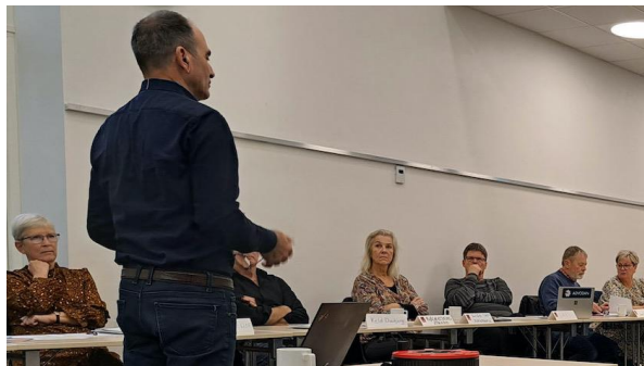
Deltagerne i et tidligere seminar

I samarbejde med SLFs advokat, har SLF sammensat et program, som henvender sig til såvel nye som erfarne bestyrelsesmedlemmer inden for sommer- og fritidshusområdet.